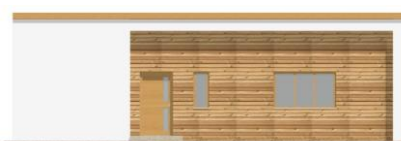
Pohled boční zleva