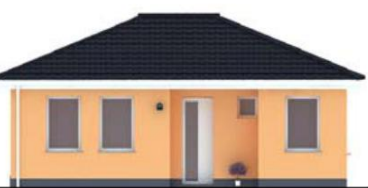
Pohled boční zleva