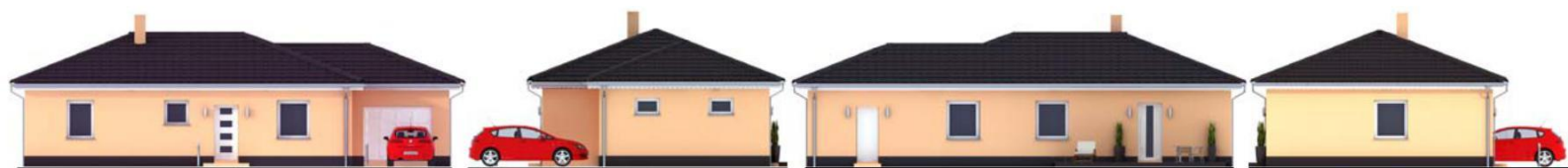
Pohled boční zleva