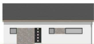
Pohled boční zleva